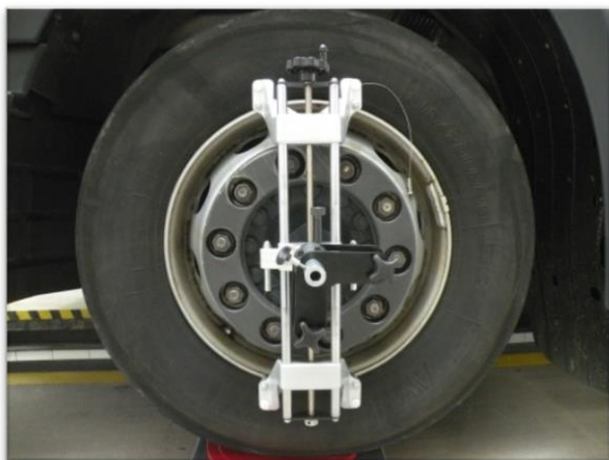
Uchwyt mocujący z kompensatorem