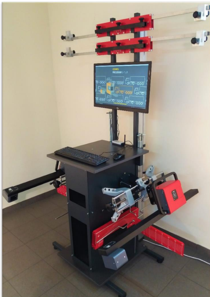
Szafka z wyposażeniem