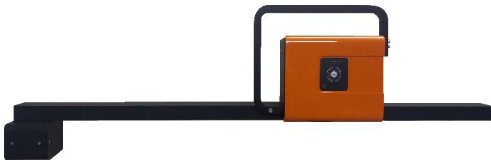
Głowica pomiarowa z i komunikacją radiową

Kontakt: Comes gl.tech@vp.pl tel. +48 600 956 530